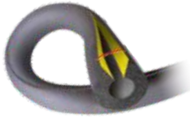
K-FLEX ST/SK Hadice

K-FLEX ST je produkt splňující všechny parametry pro použití v komerčním i průmyslovém chlazení, klimatizaci, pro topenářské a instalatérské práce, izolování nádrží, tvarovek a ve všech ostatních aplikacích kde je potřebná tepelná izolace.